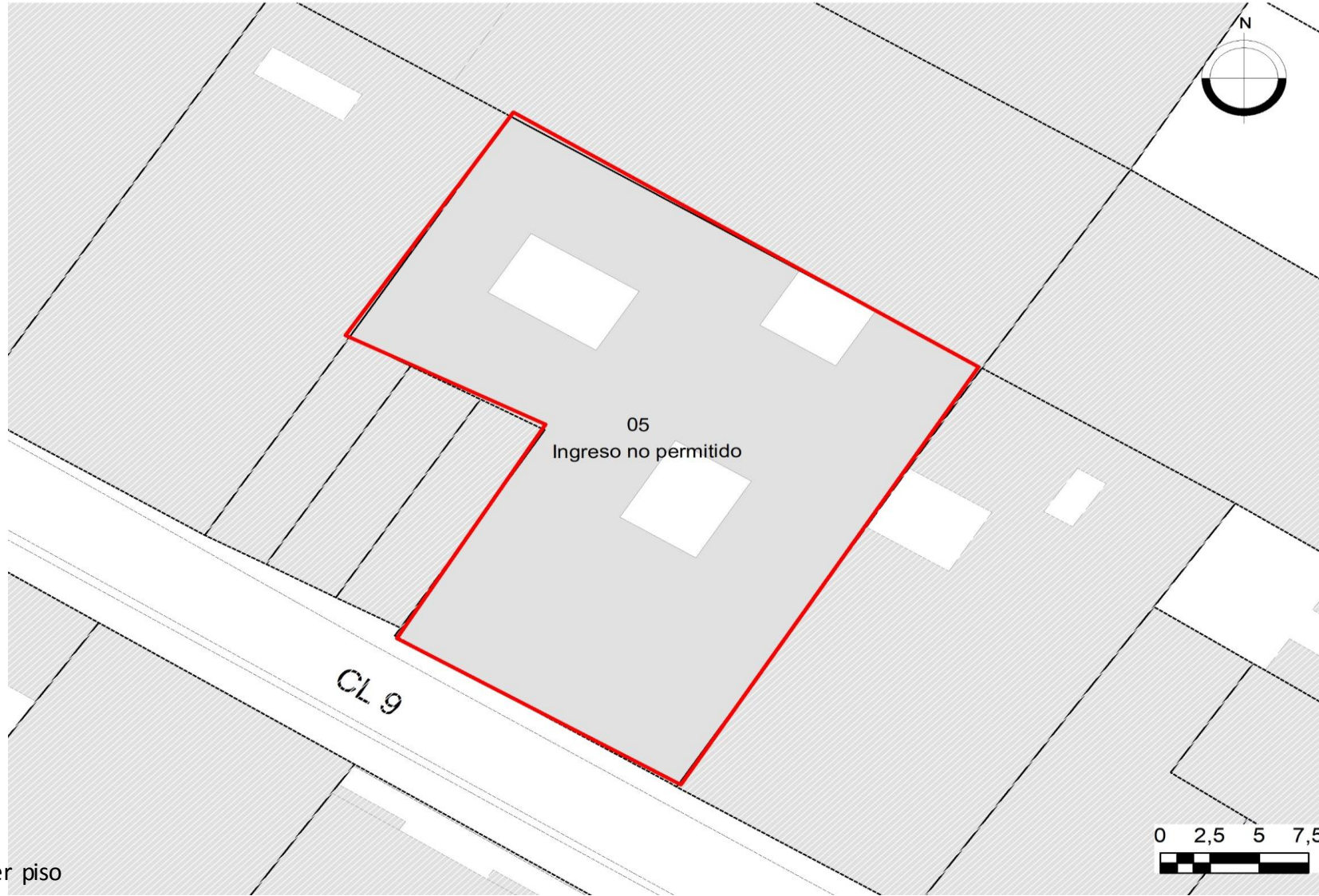
Planta primer piso